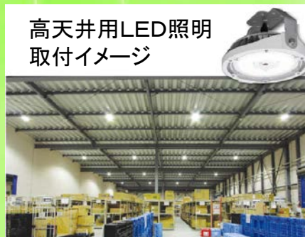
高天井用LED照明 取付イメージ

水銀灯と比較してLED照明の寿命は約5～6倍。 高所や危険箇所での交換にかかる手間や費用も削減可能です。